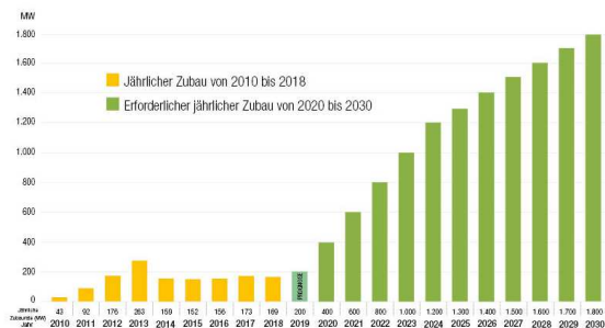
PV-Zubau in Österreich 2010 - 2018 und erforderlicher Ausbau 2019 - 2030

Beim 1-Million-PV-Dächer-Programm handelt es sich um eine Aufstockung des bestehenden 100.000 Dächer Photovoltaikprogramms, das durch die Erleichterung administrativer Hürden begleitet werden soll. So werden u.a. die rechtlichen Rahmenbedingungen für PV-Anlagen vereinfacht, die Erweiterung bestehender Anlagen ohne Verlust des Einspeisetarifs ermöglicht, die leistungsbezogenen Fördergrenzen ausgeweitet und die Installation von PV-Anlagen außerhalb von Gebäuden auf versiegelten Flächen bzw. die Doppelnutzung von Flächen gefördert.